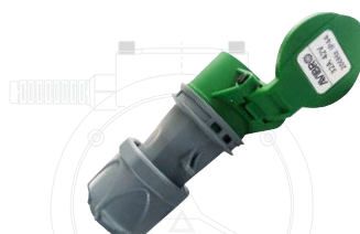
SP | Розетка