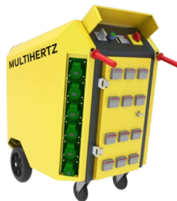
MFC - Електронні перетворювачі частоти