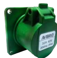
VF | Розетка