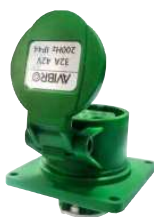
KP | Розетка